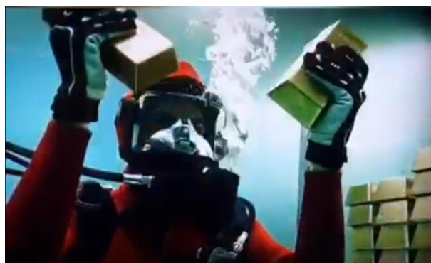
Figura 2. Escena de la Temporada 3 de “La Casa de Papel” (NETFLIX).

Y ya, como el colmo de la “fantasía metalúrgica”, una escena de la 1ª temporada de “Juego de Tronos” 4 , Khal Drogo vacía el caldero de la sopa para introducir en su interior una serie de objetos de oro que se hallan “casualmente” en la tienda de campaña; el caldero, sobre el fuego que hace un momento hacía humear un guiso, pero que ahora, sin más, alcanza una temperatura suficiente como para fundir oro (que, por cierto, funde sin alcanzar el característico aspecto ígneo de cualquier metal durante su fusión). Así, en pocos segundos, en el caldero burbujea un fluido dorado y el protagonista, sin necesidad de protección alguna, vierte su contenido sobre la cabeza de un personaje que finaliza su periplo en la serie en ese momento (Fig. 3). Lo único cierto de toda esta secuencia, es que el personaje “coronado” con el oro líquido, muere. Y que al caer al suelo (tras una solidificación inmediata e impecable del “casco” dorado), hace un ruido metálico (“¡clonc!”) característico. ¡Por favor, que nadie pruebe a hacer esto en su casa!