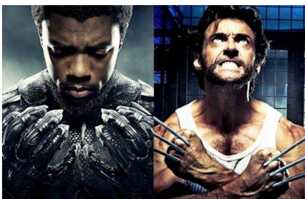
Figura 6. Vibranium de la armadura de Black Panther (izquierda) y Adamantium de las garras de Lobezno (derecha) 6 .