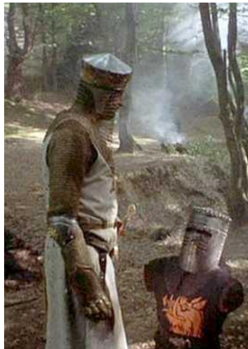
Figura 5. “El caballero negro”, escena de Monty Python en “Los Caballeros de la Mesa Cuadrada y sus Locos Seguidores”.